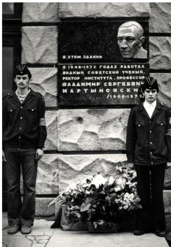
В память о В.С.Мартыновском на фасаде Академии холода установлена мемориальная доска.