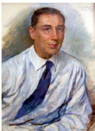
Портрет В.С. Мартыновского работы известной русской художницы З.Е. Серебрякой (Париж, 1961 г.)