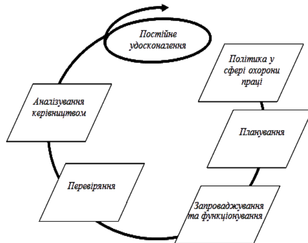
Рис.– Модель СУОП та її основні елементи (стандарт OHSAS).

Даний стандарт OHSAS базується на методології, відомої як Планування (Plan) – Виконання (Do) – Перевірка (Check) – Дія (Act) (PDCA). Коротко PDCA можна описати наступним чином: