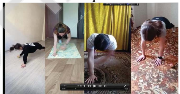
Рис.4 Динамічна планка

Особливий інтерес викликала естафета серед збірних команд інститутів.