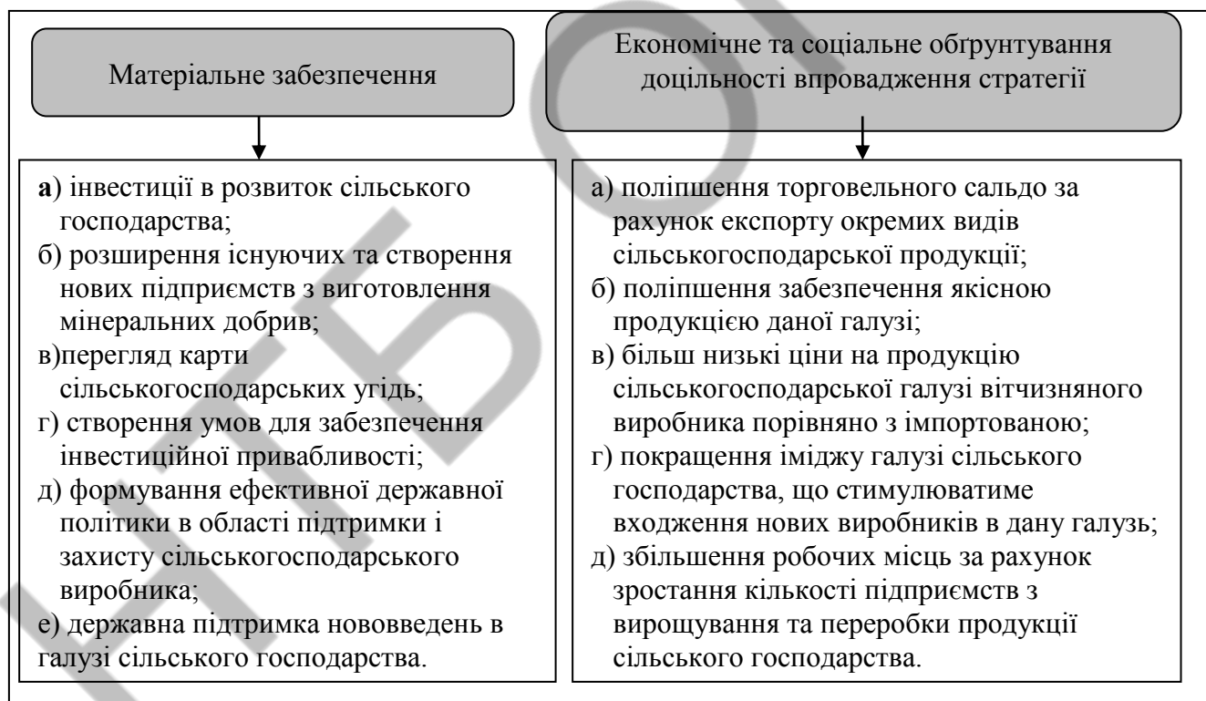
Рис. 3. Стратегія просторового розвитку сільського господарства Полтавського регіону

На основі проведеного дослідження було сформовано стратегію розвитку сільського господарства Полтавського регіону (рис.3).