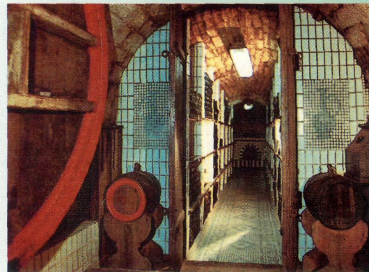
В старом погребе.

Фирма Синадино закупала в различных районах Бессарабии, преимущественно в Аккерманском уезде, ежегодно от 50 до 100 тыс. ведер и, после выдержки их в течение трех лет, сбывала оптом и в бутылках в