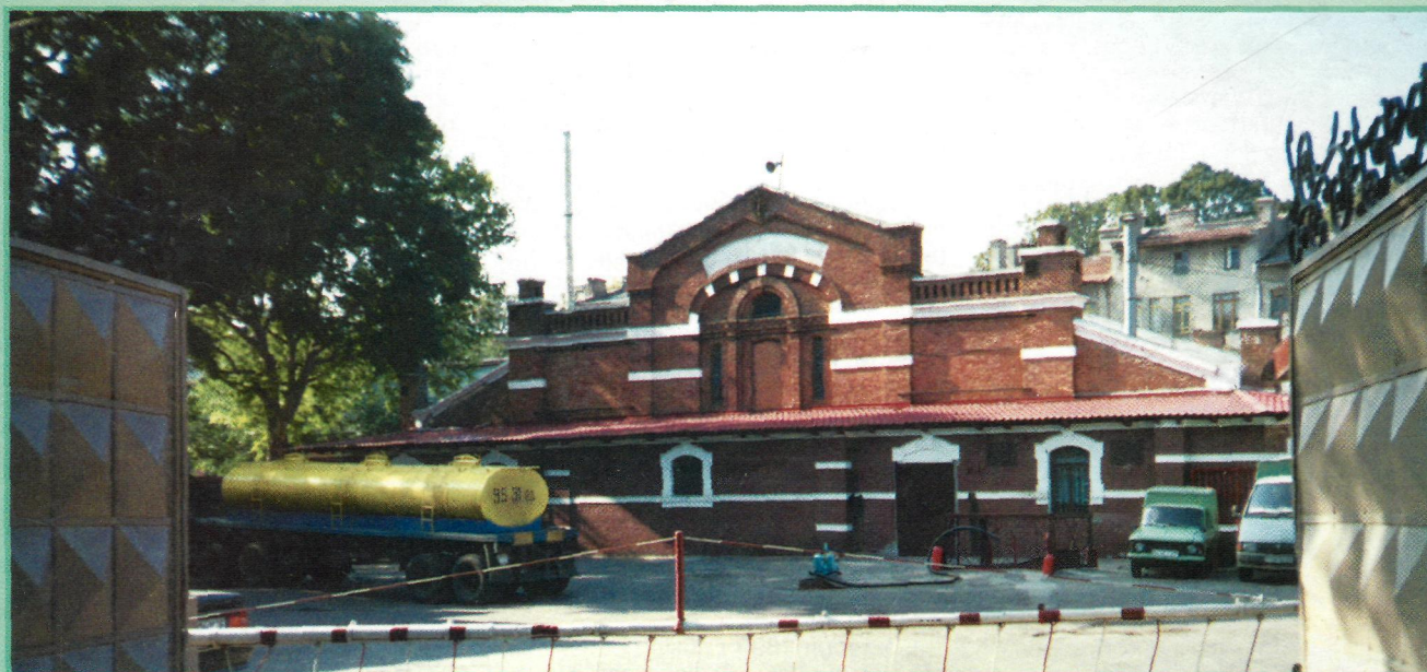
Винзавод на Французском бульваре, 10. Производственный корпус

В 1889 г. Удельное ведомство приобрело и значительно расширило подвалы фирмы Нуво, общей площадью в 1,5 дес., расположенные по Мало-Фонтанской дороге. Строительство фирмой склада для хранения и выдержки вин датируется 1857 г., что, собственно, и является точкой отсчета Одесского винзавода на Французском бульваре, 10. Покупка, ремонт и, как мы сейчас говорим, модернизация, а также пристройка 4-х новых пролетов были проведены архитектором Токаревым. В «Вестнике виноделия» за 1894 г. приводится план реконструированного подвала. Тогда он именовался Центральным винным подвалом Удельного ведомства в Одессе. В начале века его официальное название — Первый государственный винный базисный склад,