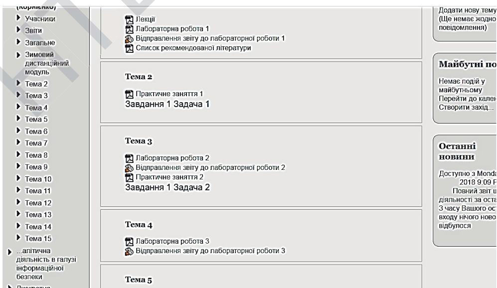
Рис.2. Фрагмент матеріалів для практичних занять та лабораторних робіт

Далі в дистанційному курсі представлені лекційний матеріал у текстовому форматі, методичні вказівки по підготовці до практичних занять з окремими завданнями, та завдання до лабораторних робіт (Рис.2), а також зразки вирішення завдань по всіх темах курсу. Виконання лабораторних робіт повинно завершуватись відправленням звіту. Остання процедура оформлена в курсі за допомогою такого виду діяльності як «Завдання», в якому налаштовуються терміни початку та закінчення виконання лабораторної роботи, максимальний об'єм та кількість файлів на завантаження.